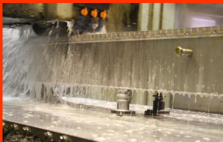
ワークのオーバーハング部や研削加工時の中空部をサポート。